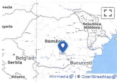
Valea Voievozilor (România)

➤ Satul Valea Voievozilor , dezvoltat pe terasele și pe zona de pe partea stângă a râului Ialomița, cât și de-a lungul văii Voievozilor și a afluenților acesteia;