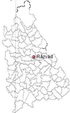
Răzvad (Județul Dâmbovița)

➤ Satul Răzvad , fiind reședința comunei, se dezvoltă pe de-a lungul DN 72 și pe văile ce formează pârâul Răzvădeanca și Slănic;