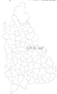
Răzvad (Județul Dâmbovița) Localizarea satului pe harta județului Dâmbovița Coordonate: 44°56'10"N 25°32'4"E

➤ Satul Răzvad , fiind reședința comunei, se dezvoltă pe de-a lungul DN 72 și pe văile ce formează pârâul Răzvădeanca și Slănic;